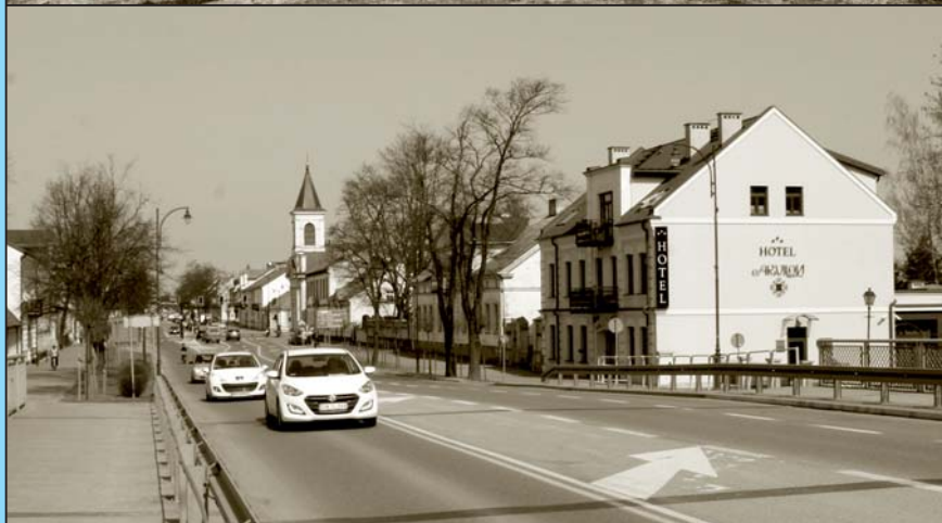
Suwałki. Most na Czarnej Hańczy u zarania niepodległości i współczesnie

PATRONI i SPONSORZY KONFERENCJI Marszałek Województwa Podlaskiego Przezydent Miasta Suwałk Państwowa Wyższa Szkoła Zawodowa w Suwałkach Małow sp. z o.o.